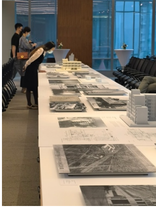
参观宾夕法尼亚大学沃顿中国中心“中国建造”展览的观众